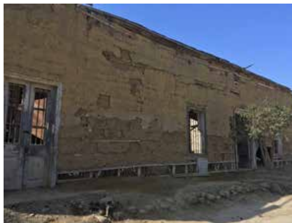
Figura 6. Resto de vivienda rural construida en quincha, región de Atacama.

Así, en la capital Santiago, por ejemplo, a nueve años de su fundación, existían sólo “siete casas definitivas” (de adobe), mientras que las demás eran de “bahareque y de paja muy ruines” (de Ramón, 2000, p. 29). Con el tiempo y por necesidades defensivas, se empezó a abandonar la quincha y la paja, pues eran materiales muy fáciles de destruir mediante incendios, y se comenzó a emplear de manera masiva la albañilería de adobe y el tapial, que conformando gruesos e ignífugos muros, se constituyeron en la mejor defensa frente a los intentos de los pueblos originarios de recuperar sus tierras. Varios son los ejemplos que dan cuenta de esta primera fase de necesidad defensiva: en la capital Santiago, el conquistador Pedro de Valdivia se construyó una “casa-fuerte” para resguardarse él y sus vecinos a un costado de la Plaza Mayor, empleando 200.000 adobes de vara de largo (83,6cm) y un palmo de alto (21cm) (de Ramón, 2000); Santiago tuvo una muralla defensiva construida con adobes alrededor