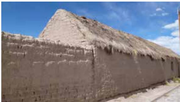
Figura 4. Vivienda aymara de adobe en Colchane, región de Tarapacá.

4) y a veces uno o dos pequeños vanos destinados a ventana, todas características que develan su carácter de refugio, debido al adverso clima del altiplano y la precordillera de los Andes (Benavides, 1941/1988; Šolc, 1975/2011; Benavides et al., 1977).