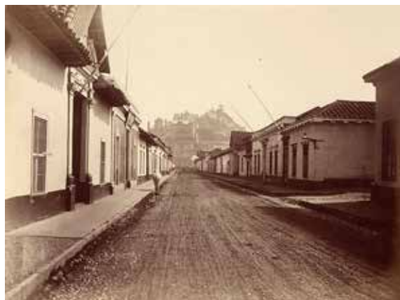
Figura 7. Viviendas coloniales de Santiago en 1874 (hoy desaparecidas).

Otra tipología muy característica es la hacienda, grandes conjuntos que nacieron como fruto del sistema productivo latifundista importado por los españoles. La hacienda se caracteriza por poseer una planta ortogonal con varios núcleos organizados en torno a patios interiores, divididos en áreas destinadas a la habitación, y otras a los procesos de producción propios del sistema de haciendas. Existen también acá variantes regionales observadas en los trabajos