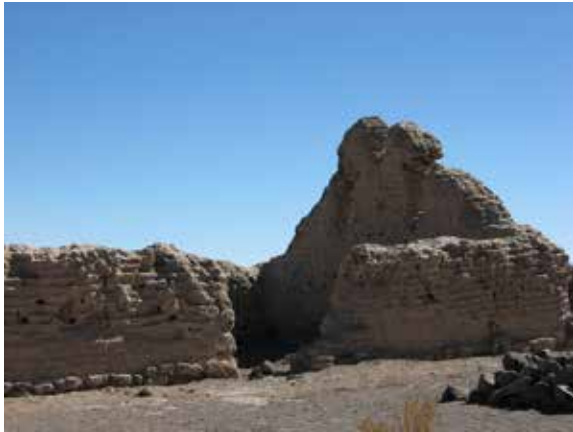
Figura 3. Kallanka Inka en Turi.