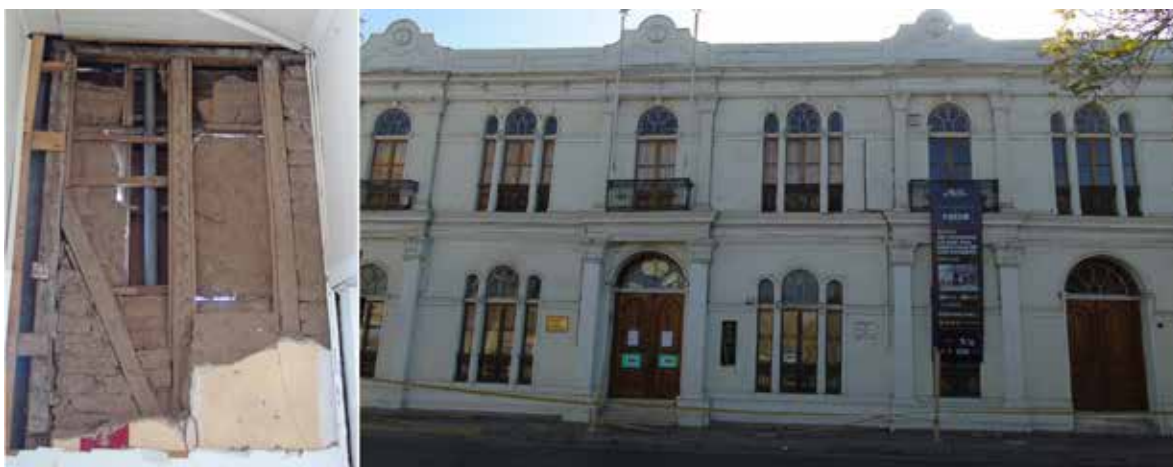
Figura 13. Vivienda de Gabriel González Videla, actual Museo de Historia Natural de La Serena (der.) y detalle del interior de su segundo piso construido en adobillo, dañado por un sismo, en enero del 2019.