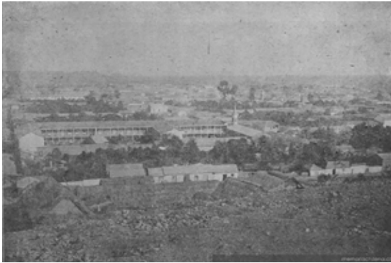
Figura 10. Vista desde el alto del centro de La Serena en 1903, donde en primer plano se aprecian los techos de totora.

se siguió empleando la cubierta vegetal de totora ( Schoenoplectus californicus ) en las construcciones de adobe (Figura 10), hasta bien entrado el siglo XIX (Concha, 1871/2010; Galdames, 1964).