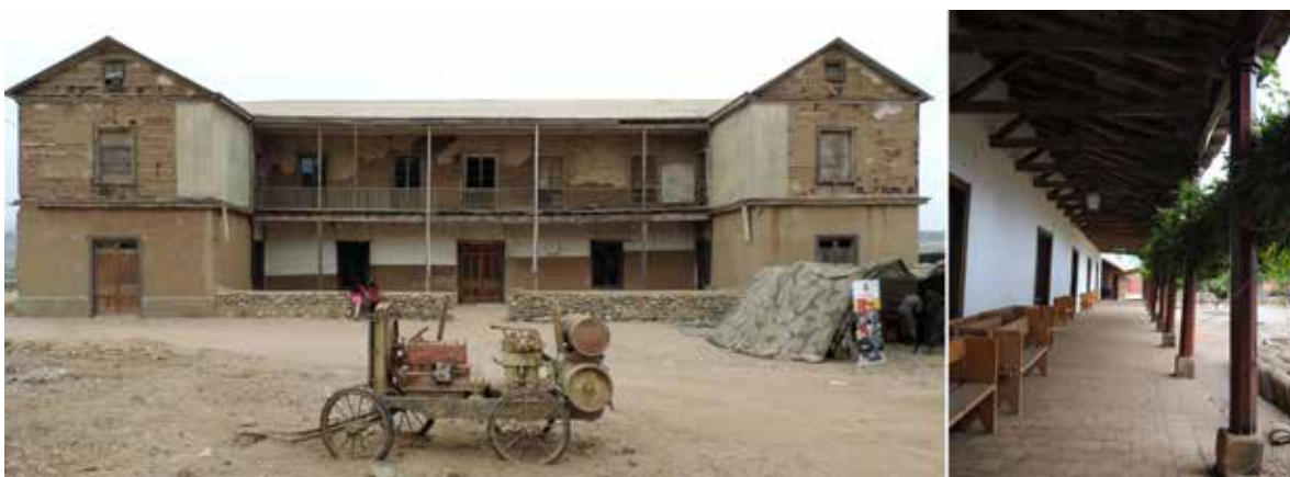
Figura 9. Hacienda en La ciudad de La Serena (izq.) y Hacienda Huilquilemu en la región del Maule.

En el periodo después del terremoto de 1730, la práctica de construir inmuebles en adobe con techos de tejas y cierres de tapial, se transformó en una política de Estado que quedó establecida en normas, como en las “Instrucciones para la Fundación de San Felipe” (1740) que sirvió de base para la fundación de muchas otras ciudades. Para atraer a los campesinos, se regalaban las tierras a cambio de “cerrar su predio con muros de tapia y levantar una casa con techo de tejas” (Lacoste et al., 2014, p. 91). Una única excepción la constituyó la ciudad de La Serena, donde