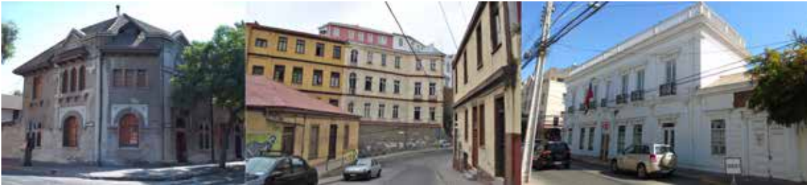
Figura 11. Viviendas republicanas en Santiago (izq.), Valparaíso (centro) y La Serena (der.).

Santiago, Valparaíso y La Serena, la tierra se siguió empleando en el ámbito residencial, pero mezclada con el uso de la madera (principalmente de pino Oregón americano y roble), diversificando las técnicas como nunca antes.