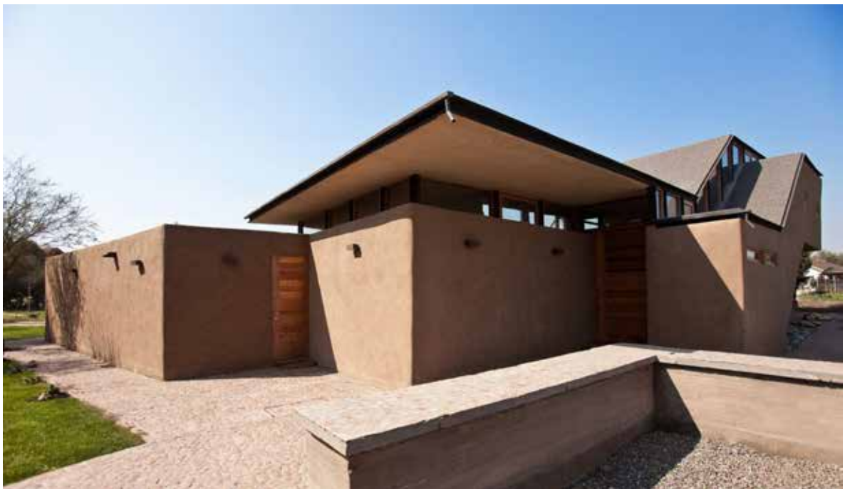
Figura 14. Vivienda de estructura de acero y relleno de tierra, obra de Surtierra Arquitectura. Créditos: Surtierra Arquitectura. http://www.surtierraarquitectura.cl/

Ha sido también la actividad sísmica, en conjunto con la búsqueda de una arquitectura sustentable, lo que ha impulsado la utilización de técnicas de construcción mixtas que incorporan la tierra, en las últimas décadas. Así, diversos arquitectos y “bio-construtores” interesados en construir con materiales naturales y a disposición en el lugar, han experimentado utilizando técnicas de construcción donde la estructura portante la hace la madera, el acero e incluso los neumáticos reciclados, y el relleno lo hace la tierra y la paja (Figura 14), dando lugar a un sinnúmero de variantes técnicas y de experimentaciones formales en la arquitectura que, en todos los casos, han demostrado ser sismorresistentes.