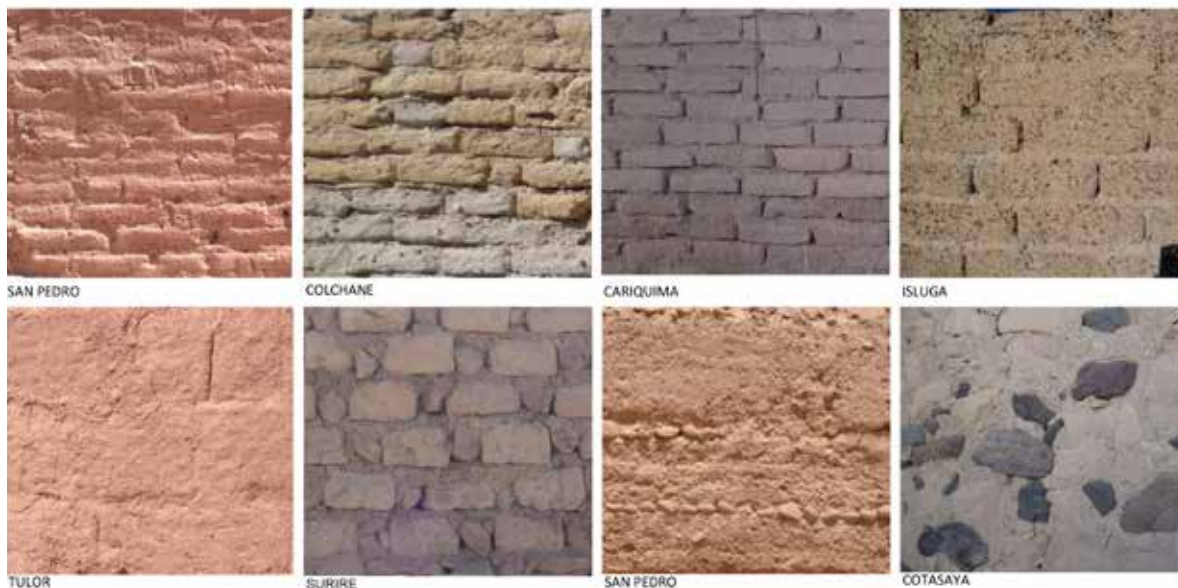
Figura 5. Uso de la tierra bajo distintas formas en la arquitectura andina

En el Norte Chico (regiones de Atacama y Coquimbo) y Valle central chileno (regiones desde Valparaíso al Bío-bío) en cambio, dada la mayor disponibilidad de vegetación, existió la quincha como técnica principal, es decir, un entramado de madera, relleno con fibras vegetales y tierra, de la cual, debido a lo perecedero de los materiales y a que estas áreas fueron densamente pobladas desde la Colonia española, hoy no quedan vestigios, y se sabe de ellas sólo gracias a los primeros