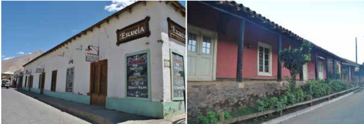
Figura 8. Comparación de viviendas coloniales rurales del Norte Chico (izq.) y Vichuquén (der.).

de campo: en la macro región conocida como “Norte Chico” (regiones de Atacama y Coquimbo) existen muchas haciendas de dos pisos, construidas en adobe en su primer piso y en quincha en su segundo; en la zona central chilena en cambio (regiones de Valparaíso, Metropolitana, O’Higgins, Maule y Ñuble), la mayoría de los conjuntos son de un único piso, construidos en adobe y tabiques con adobes en pandereta, poseen además, amplios corredores techados que permiten el trabajo al aire libre protegido de las inclemencias del clima (Figura 9). Esta tipología del valle central es quizás la más documentada de todo el patrimonio arquitectónico chileno (Gross, 1964; Guarda, 1969; Benavides, 1941/1981; Del Río y Gutiérrez, 1999), no así la de la zona norte, a pesar de que ambas se encuentran en buen estado de conservación a pesar de los numerosos y frecuentes sismos y forman parte del valioso patrimonio construido en tierra chileno.