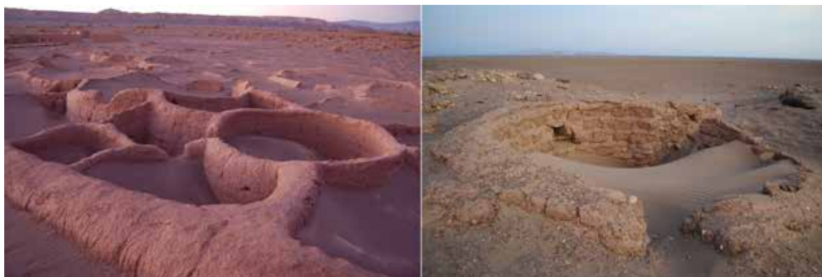
Figura 2. Comparación entre los muros de la Aldea de Tulo (izq.) y la Aldea de Ramaditas (der.)

Es entonces en el Período Tardío, caracterizado por el dominio incaico, que se difunde el paralelepípedo como forma de construir, asociado a la arquitectura Inca (Hyslop, 2017). De ese proceso de lento traspaso hacia las plantas rectangulares, aparece lo que hoy conocemos como la vivienda “andina”, situada en Chile en la precordillera y el altiplano de las mismas regiones antes mencionadas, donde aún viven en sus moradas las etnias Aymara, Quechua y Atacameña, culturas vivas que forman parte de la rica diversidad del Chile actual. Estas viviendas poseen patrones en común con viviendas de la macro área andina: pequeños volúmenes de forma ligeramente piramidal, con techumbre a dos aguas de pronunciada pendiente, una puerta de entrada en su centro (Figura