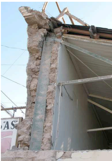
Fig. 5. Parte de la Pulpería, donde la caída del fímpano permitió descubrir la presencia de la estructura de hierro embebida en los guesos muros de adobe.

es de todos los edificios, el que más intervenciones presenta, lo que ha debilitado mucho su estructura y por tanto luego del sismo del 2007, se encuentra muy dañado (ver Fig. 5).