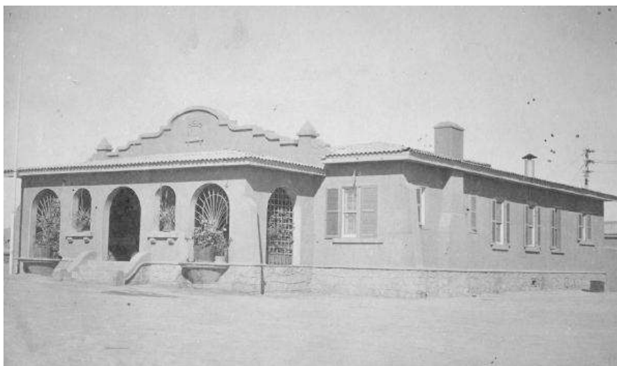
Fig. 2. Estilo "New Mexico" característico por sus frontones que rematan con figuras geométricas curvas.

Esta organización inicial de la ciudad, aún hoy se mantiene y está completamente vigente en todos sus usos, existiendo un