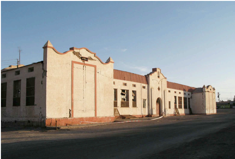
Fig. 4. La ex Escuela Consolidada, el edificio más emblemático de María Elena. (Créditos: Surtierra Arquitectura, 2008)

Por último, en el costado poniente de la plaza, se ubican el Mercado y la Pulpería de la ciudad, ambos edificios de grandes luces, construidos en sistema adobe-estructura metálica; la Pulpería lamentablemente