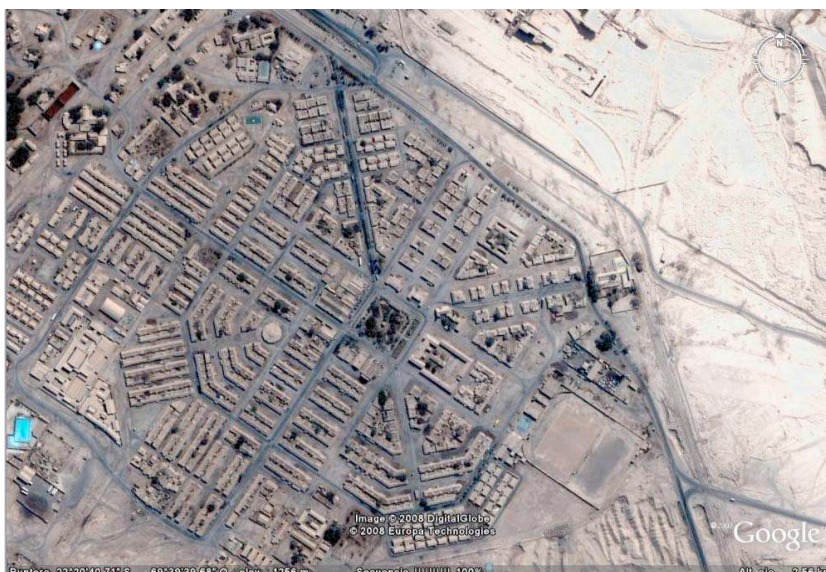
Fig. 1. Foto aérea donde se aprecia el trazado que hace alusión a la bandera inglesa. (Créditos: Surtierra Arquitectura, 2008; fuente: Google Earth)

Actualmente el territorio de María Elena y la totalidad de sus edificios pertenecen a la empresa privada SQM (Sociedad Química Minera), sin embargo por poseer una población superior a 6 mil habitantes, el Estado chileno cedió su administración a un Municipio; esta dualidad entre propiedad privada y administración pública ha llevado a más de una divergencia al momento de intervenir el espacio urbano y sus edificios, sobre todo luego del terremoto de Noviembre del 2007, cuando el Municipio frenó las labores de demolición llevadas a cabo por la empresa sobre un gran número de edificios dañados, y llamó a su restauración a través del Ministerio de Obras Públicas.